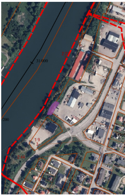
Figur 1. Flygfoto med markerat åtgärdsområde.

Området vid Edet, beläget på östra sidan om Göta älv i Lilla Edets tätort, har sämre stabilitet i ett litet område söder om tidigare genomförda avschaktningar. Fördjupad geoteknisk utredning har genomförts av Statens geotekniska institut (SGI). För att förbättra stabiliteten behöver avschaktning eller annan åtgärd genomföras på en privat fastighet, Cementgjutaren 2 samt den kommunala fastigheten Edet 2:44. Aktuellt område (markerat med lila) framgår av figur 1 och 2 nedan.