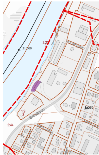
Figur 2. Åtgärdsområde.

Möjlighet har tidigare funnits att ansöka om 70 % stadsbidrag för stabilitetshöjande åtgärder hos SGI. Resterande 30 % har fått finansieras av fastighetsägarna. Från den 18 december 2020 kan SGI ge bidrag för hela eller delar av kostnaden för planering och åtgärd av områden som ligger utefter Göta älv.