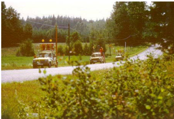
Figur 4: Ett motoriserat avvägningslag i arbetens dragningskraft genom s.k. tidjordskorrektion.

Mätningarna genomfördes huvudsakligen 1979-2001 med s.k. motoriserad avvägningsteknik (se figur 4). Vid mätningarna användes avvägningsinstrumentet Zeiss Jena Ni002 och dubbelskaliga kalibrerade invarstänger. Mätningarna har påförts korrektion för jordkrökning, temperaturkorrektion och stånglängdskorrektion. Dessutom korrigeras för solens och mä-