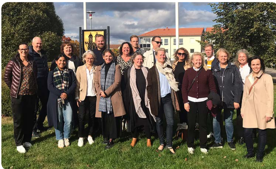
På bilden ser vi representanter från Företagscentrum, Fastighetsägarna GFR, AB EdetHus och Lilla Edets kommun som deltagit i arbetet kring målbild för centrumutveckling.