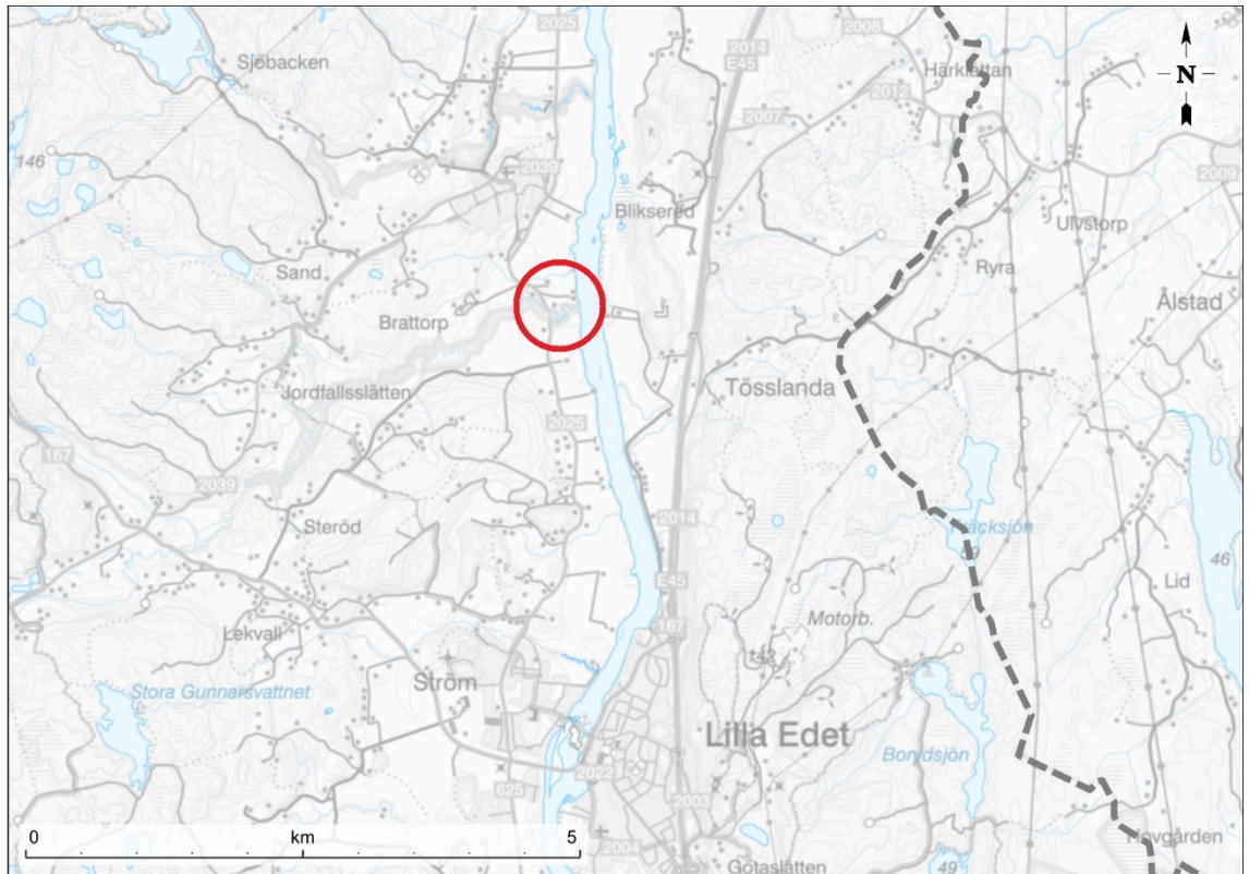
Figur. Översiktskarta med ring kring möjliga åtgärdsområde.

En geoteknisk utredning har genomförts av Statens geotekniska institut (SGI). För att förbättra stabiliteten kan avschaktning eller annan åtgärd behöva genomföras.