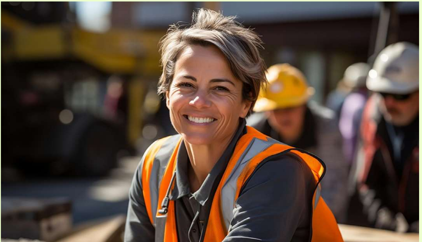
Trots en sänkning till NKI 76 får Lilla Edets kommun fortsatt bra betyg från kommunens företagare.