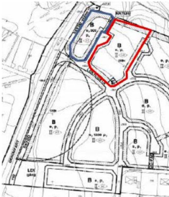
Område planändringen avser

Markanvändningsområde E, utgår då det inte finns behov av transformatorstation, och ersätts med användning B för bostäder.