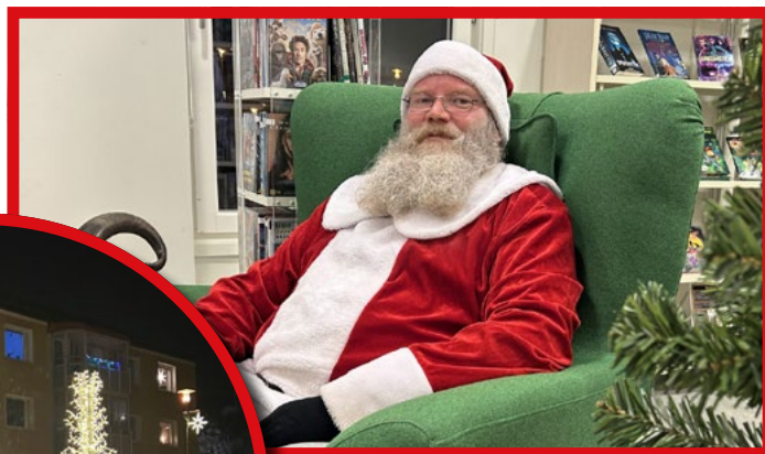
Givetvis var tomten på plats och glädde stora som små.

Marknaden arrangerades av Företagscentrum Lilla Edet i samarbete med Lilla Edets kommun.