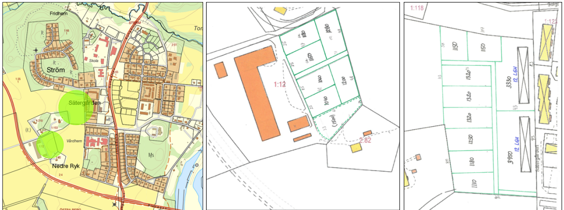
Figur 1. Översiktskarta, Ström

Resmo Fastighets AB inkom 2018-02-13 med en planbeskedsansökan till kommunen. Ansökan avser en planläggning av fastigheterna Ryk 1:12 och Ström 1:35. Enligt ansökan avser sökande planlägga för 15 villor och 24 hyreslägenheter inom respektive fastighet. Förslaget bedöms enligt inkommen situationsplan ta i anspråk cirka 18 000 m 2 respektive 8 500 m 2 brukbar jordbruksmark.