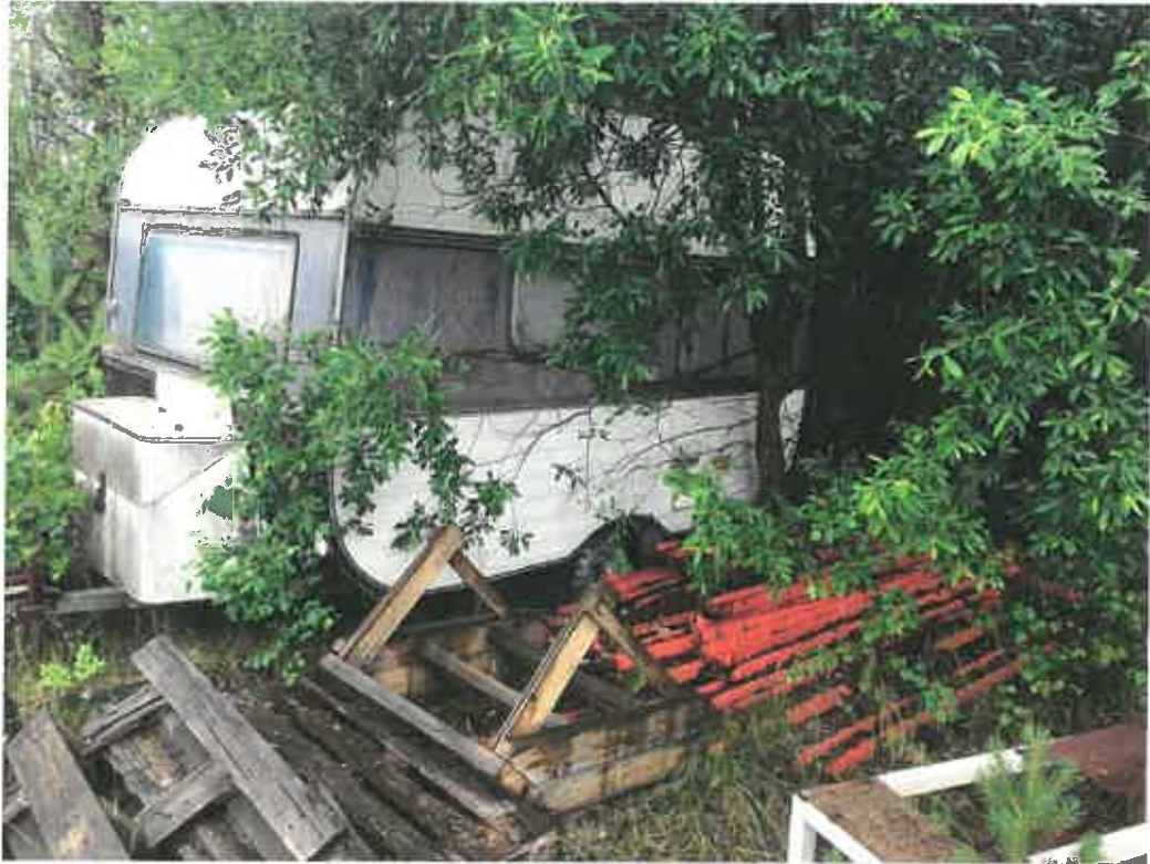
Bild 4, husvagn