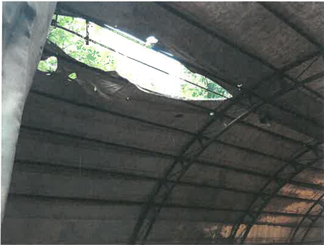
Bild 2, förrådstält