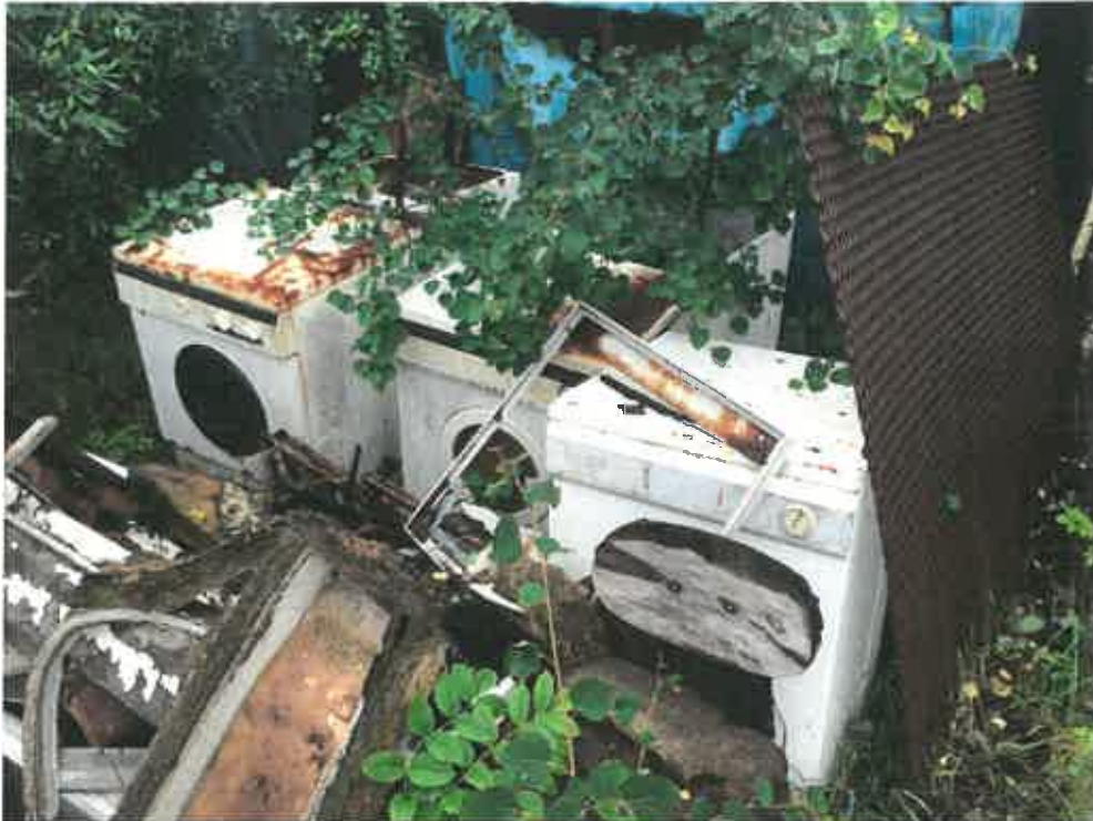
Bild 6, hushållsmaskiner