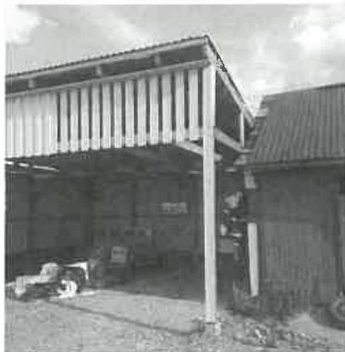
Bild på taket som ändrats till pulpettak.

Fastighetsägaren var inte på plats under besöket men det fanns nyinflyttade hyresgäster på fastigheten. Vid besöket var ombyggnaden av taket påbörjat enligt bilden nedan.