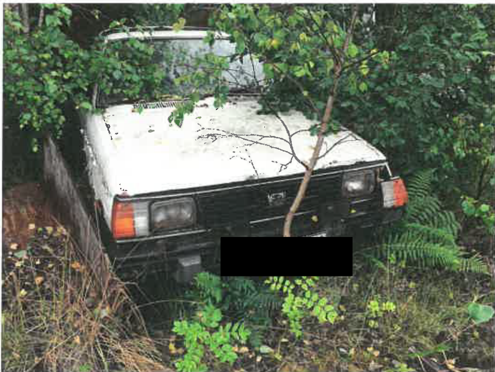
vit Subaru reg nr. [redacted]