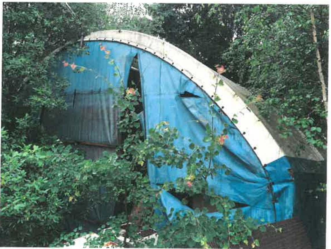
Bild 1, förrådstält

Lantmäteriet Fastighetsinskrivning, 761 80 Norrtälje