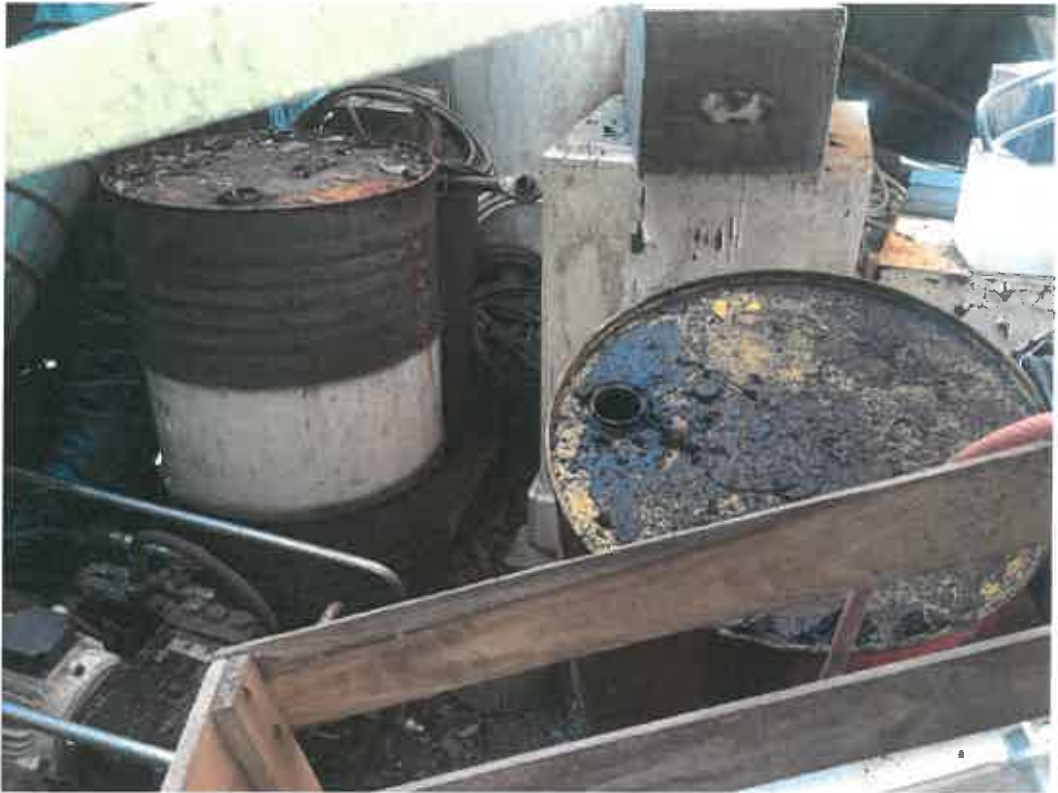
Bild 8, oljefat - invändigt från förrådstältet