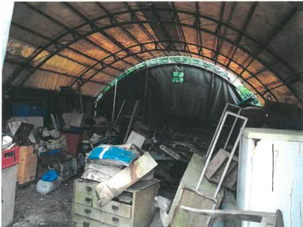
Bild 7, skåp/ möbler - invändigt från förrådstältet