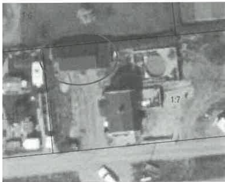
Flygfoto från 2016 som visar ett sadeltak.

Fastighetsägaren har efter tillsynsbesöket valt att ändra tillbaka taket till sadeltak enligt bilden nedan: