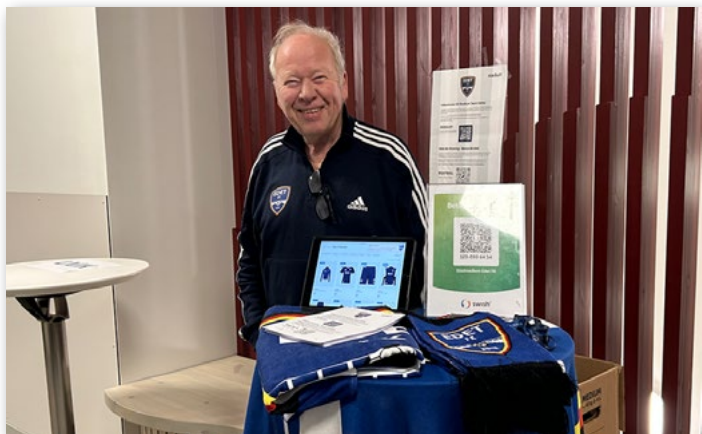
Edet FK på plats.