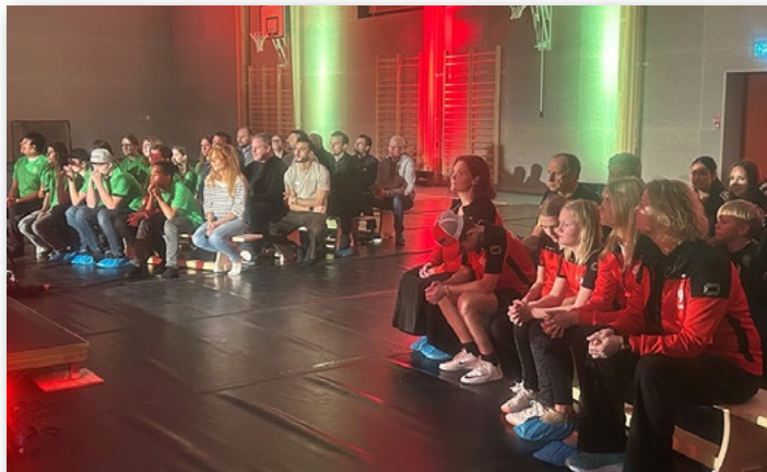
Representanter från idrottsföreningar och från Fuxernaskolan var specialinbjudna.