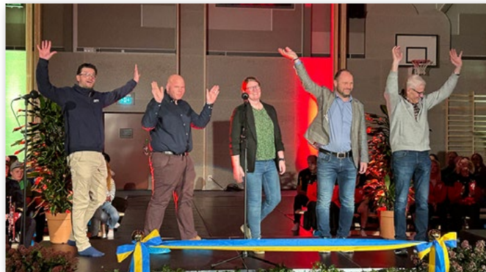
Representanter från EdetHus.