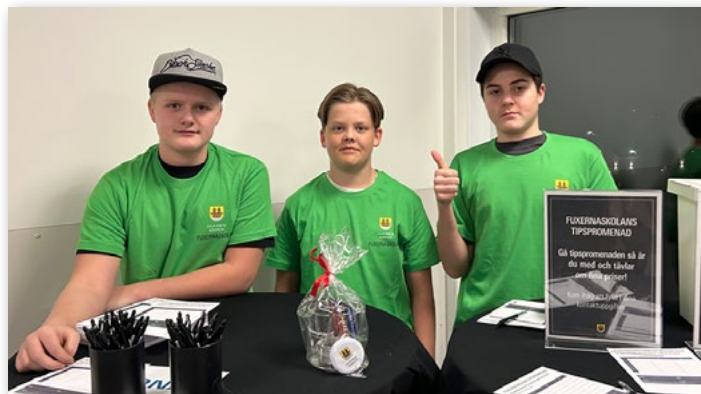
Fuxernaskolans elever hade fixat tipspromenad.