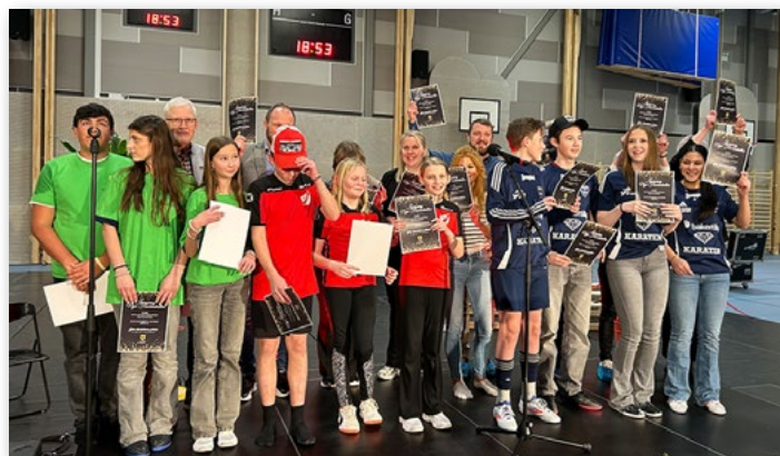
Alla som var med i utmaningen fick diplom.