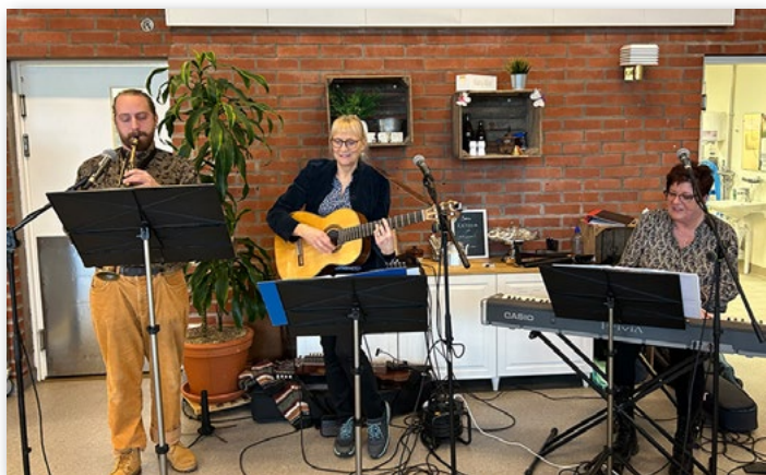
Kulturskolan spelade för eleverna i Fuxernaskolan under lunchen på invigningsdagen.