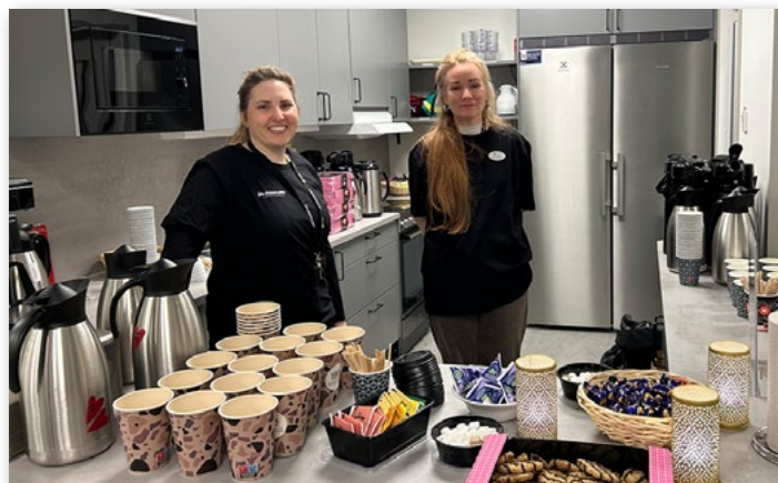
Besökare fick såklart fika.