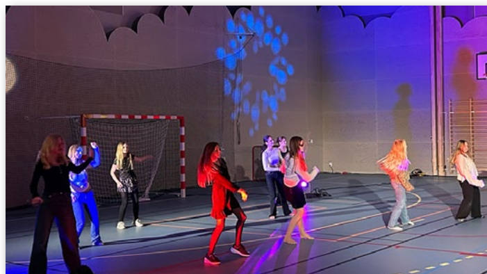
Dansuppsvisning med Kulturskolans elever.