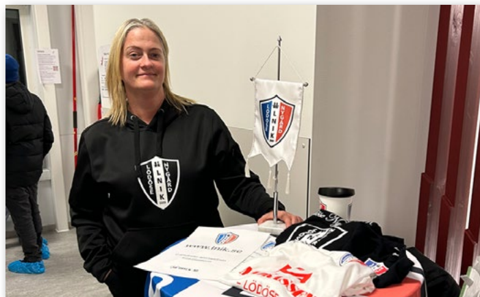
LNK fanns på plats med monter.